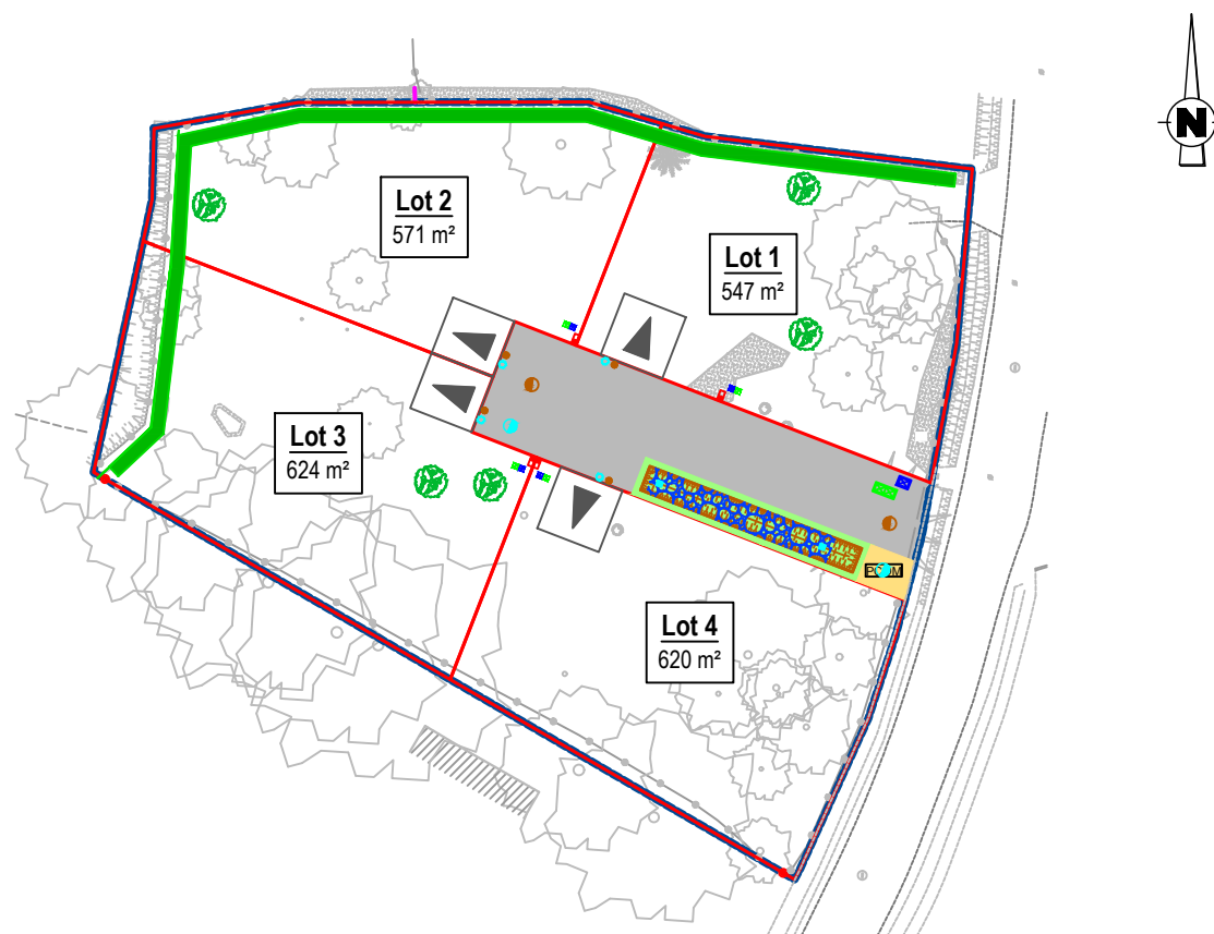
Plan de situation (sans échelle)