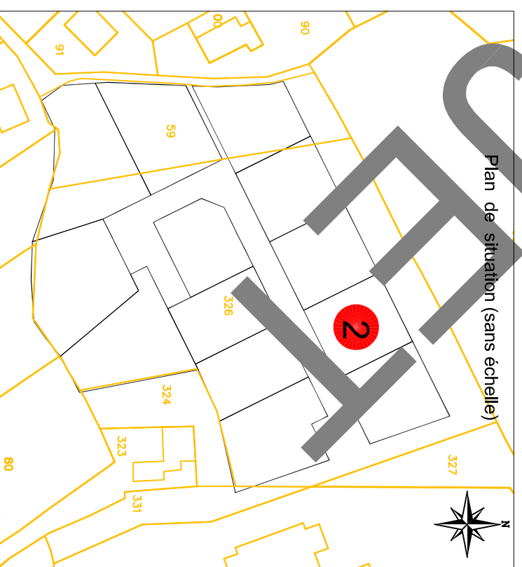
Plan de situation (sans échelle)