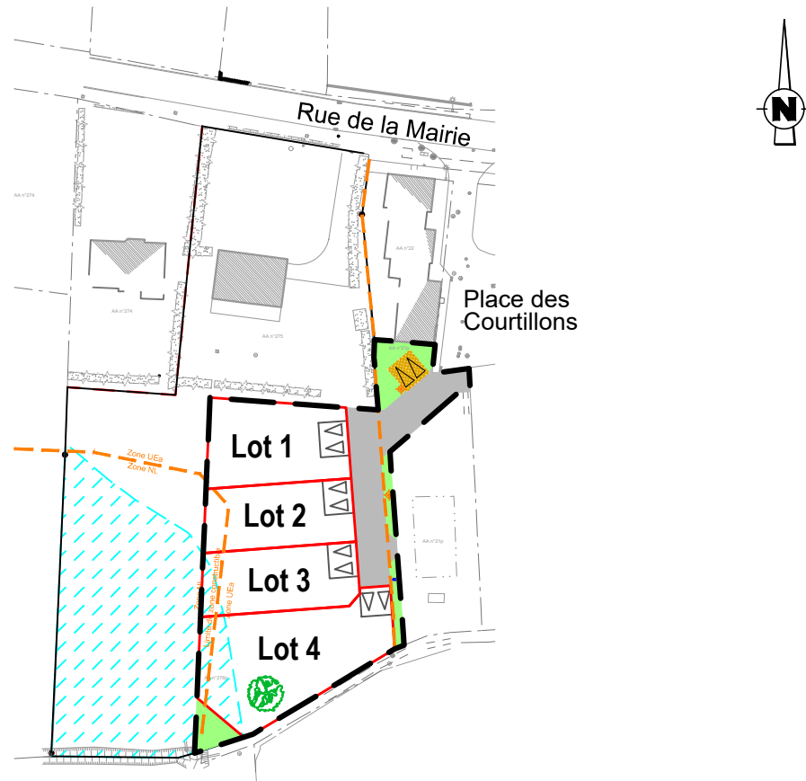
Plan de situation (sans échelle)